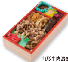
山形牛肉壽喜燒便當