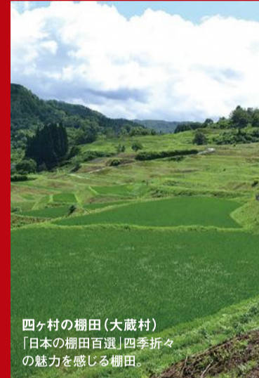
四ヶ村の棚田(大蔵村) 「日本の棚田百選」四季折々の魅力を感じる棚田。