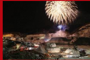
おおくら雪ものがたり 冬の花火をバックに世界一の巨大雪だるまが目見え。