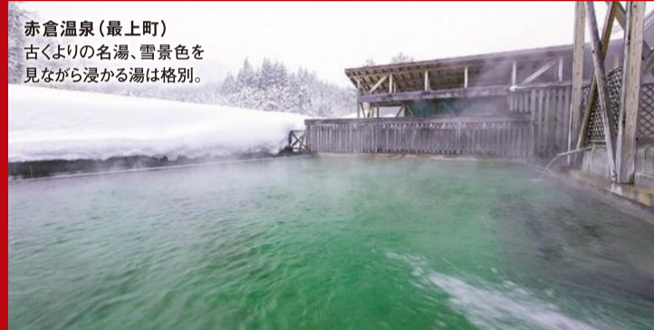
赤倉温泉(最上町) 古くよりの名湯、雪景色を見ながら浸かる湯は格別。