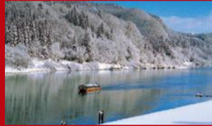
最上川舟下り(戸沢村) 松尾芭蕉「おくのほそ道」ゆかりの地で船頭の舟歌に耳を傾け情緒的な景色を堪能。