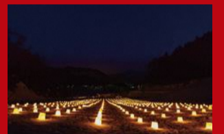
灯々祭(最上町) 雪原の約1000個のランタンに灯がともる幻想的な世界。