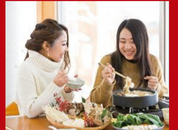
きのこしゃぶしゃぶ(鮭川村) きのこ好きにはたまらない、きのこ尽くしの独創的な料理。