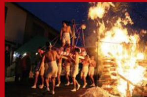
冬のはだかみこし(金山町) 裸でみこしを担ぐ迫力の伝統行事。