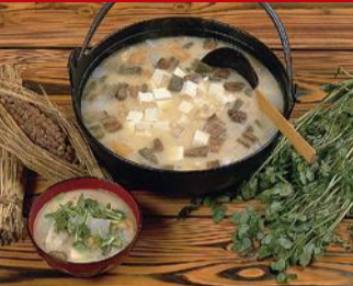
納豆汁 旬の味をまるごと味わえる郷土料理。