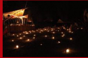
縄文炎まつり(舟形町) 太古を感じる野焼きと炎が広がる非日常的な空間。