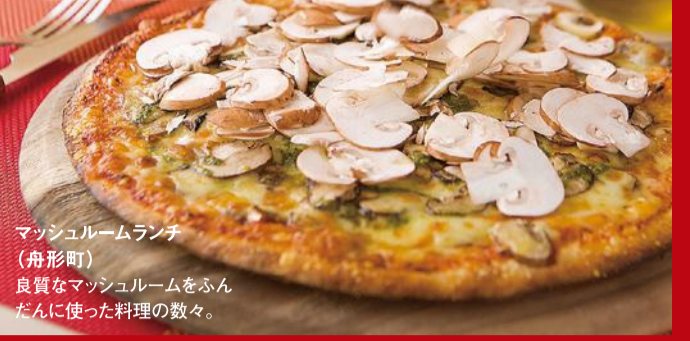
マッシュルームランチ(舟形町) 良質なマッシュルームをふんだんに使った料理の数々。

豊かな自然が育む野の幸・山の幸や伝統料理など、一味違う「食のおもてなし」に舌鼓。