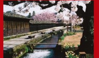
金山大堰 どこか懐かしさを感じる美しい街並み。