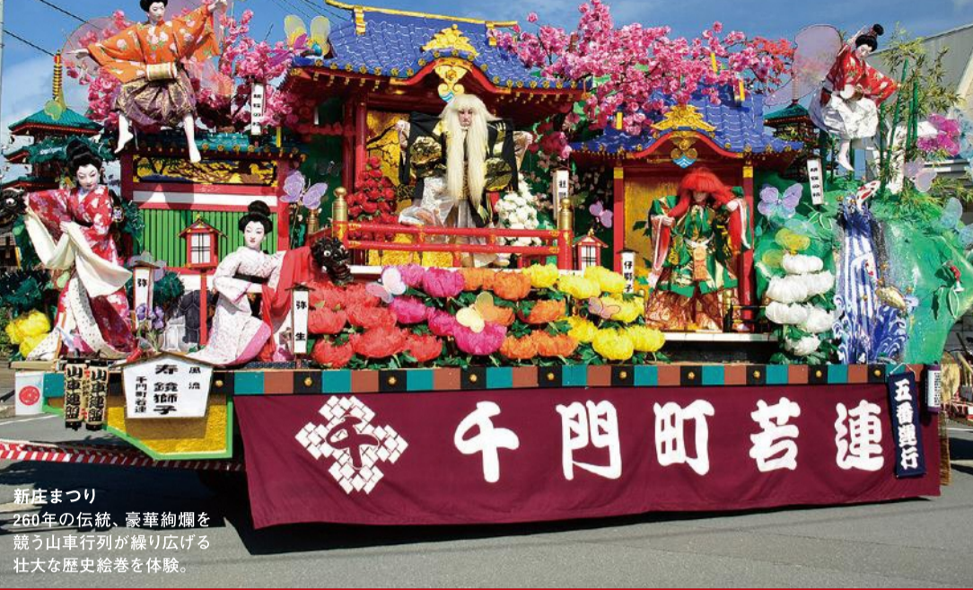
新庄まつり 260年の伝統、豪華絢爛を競う山車行列が繰り広げる壮大な歴史絵巻を体験。

ユネスコ無形文化遺産「新庄まつり」の山車(やたい)行事や、自然が織りなす幻想的な祭の数々。祭りに参加して忘れられない旅に。