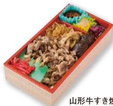
山形牛すき焼き弁当