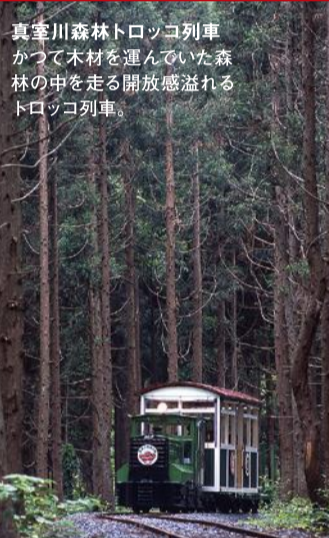
真室川森林トロッコ列車 かつて木材を運んでいた森林の中を走る開放感溢れるトロッコ列車。