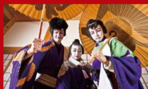
鮭川歌舞伎/隈取り着付け 日本の伝統芸能「歌舞伎」の隈取りと衣装を体験。